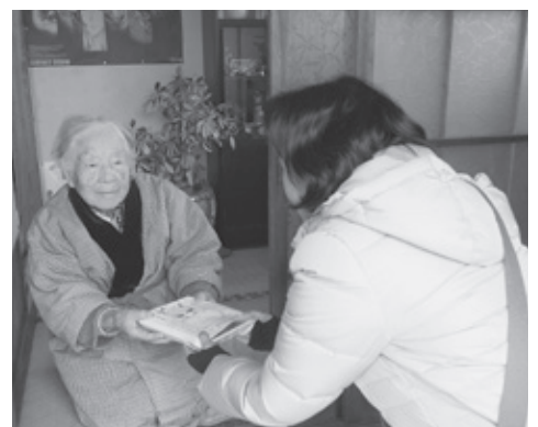
給食サービス「75歳以上の1人暮らしの方へ手作りのお弁当を配布」