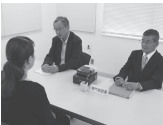
心配ごと相談・法律相談