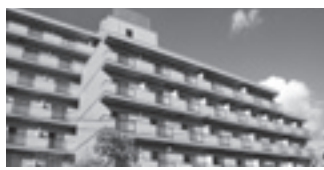
ご見学随時承ります