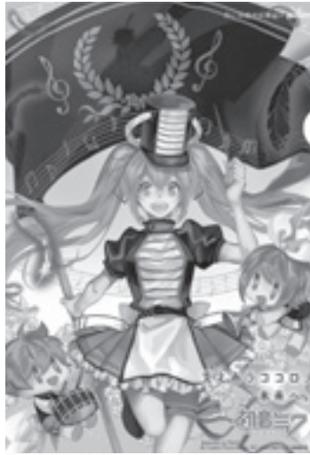
Illustration by ReOn ©Crypton Future Media, INC. www.piapep.net #HMP19

赤い羽根共同募金は、高齢者、障害者、子どもたちなどへの、地域の福祉活動を支援する募金です。また、災害時には「災害ボランティアセンター」の設置や運営など、被災地支援にも役立っています。 みなさんから寄せられた募金は、全額千葉県共同募金会に送金し、翌年度に配分金として高齢者、障害者、ひとり親家庭等様々な手助けを必要としている地域の人々のために、身近なところで活かされています。私たちの町の福祉活動の財源として活かされる共同募金にご協力ください。 今年の町の目標額は、151万円で、一世帯あたり500円を目安に自治会を通じて募金をお願いします。 また、12月1日から、歳末たすけあい募金運動が始まります。75歳以上のひとり暮らしの方へのおせち料理の配布や福祉団体、福祉施設の実施する事業に助成を行います。 なお、詳しくは回覧及び町広報11月号をご覧ください。 みなさんのご協力をお願いします。