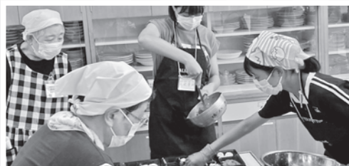
給食サービス「菜のはな会」(おべんとうづくり)