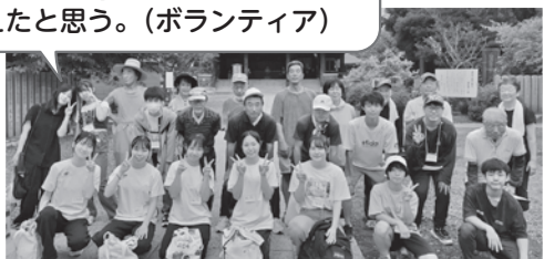
明るい社会づくり運動北総協議会 酒々井支部 (宗吾霊堂清掃)