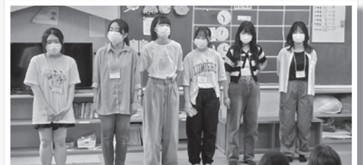
大ちゃん学童クラブ(学童保育)