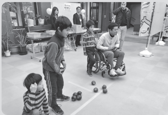
※令和元年度開催の様子