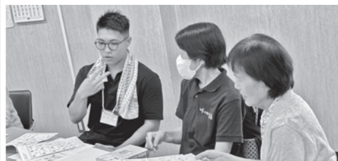
手話を学ぶ会「仲間」(手話を学ぼう)