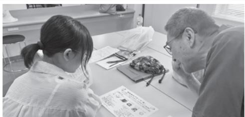
朗読奉仕グループ「虹」(声の広報)